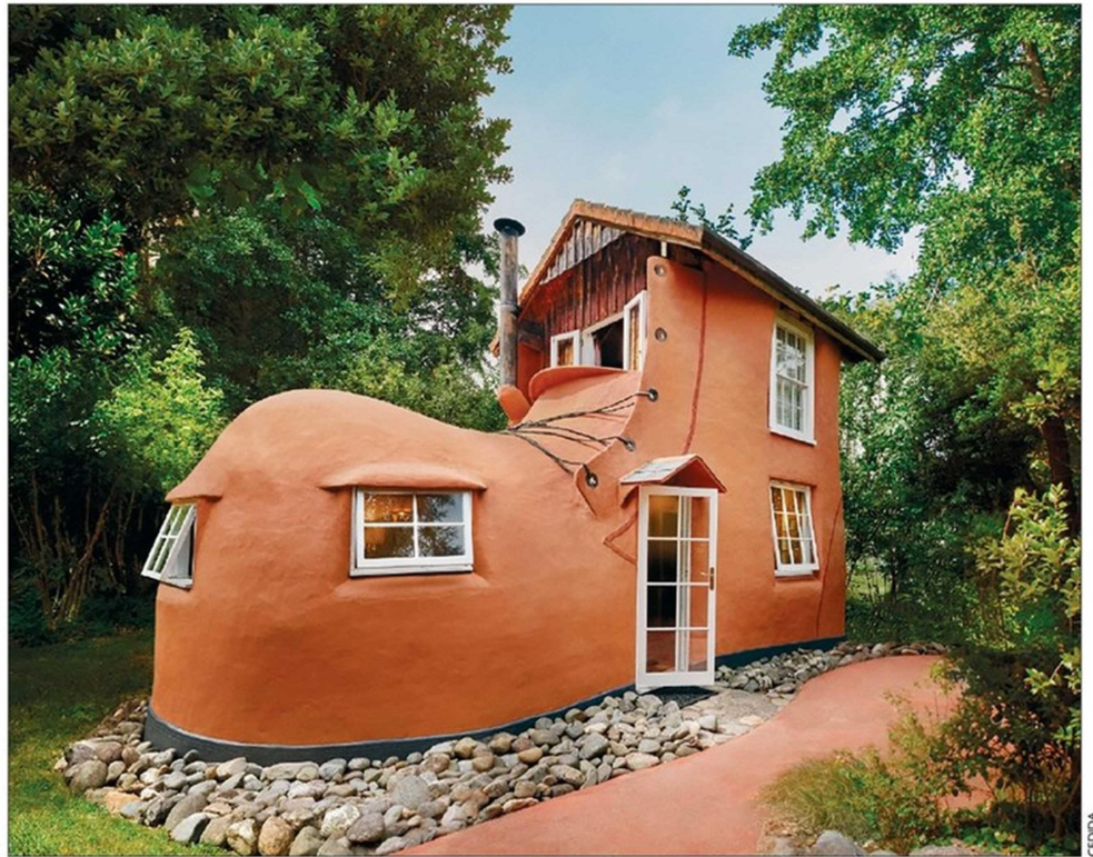
La mini casa de cueros The Boot, ubicada cerca de la ciudad Motuekan en Australia. Tiene dos pisos, cuesta $162.914 la noche.