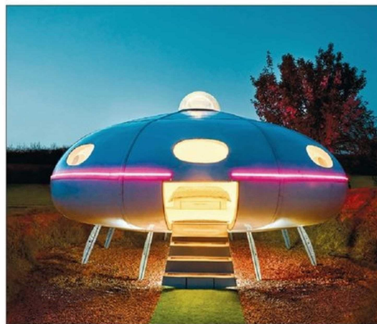
The Ovni es una habitación futurista para cuatro huéspedes en Redberth, Reino Unido. La noche cuesta $196.382.

No necesita saber de construcción ni de arquitectura para postular al concurso, el cual busca masificar los alojamientos que brindan experiencias únicas.