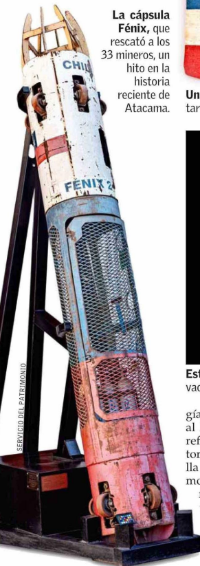
La cápsula Fénix, que rescató a los 33 mineros, un hito en la historia reciente de Atacama.