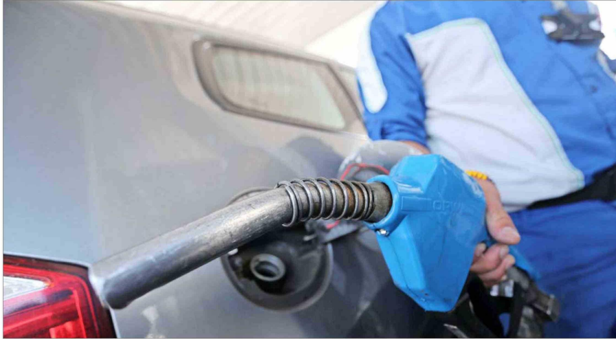
El informe de precios de la Enap determina que a partir de hoy se empezará a observar una baja en los valores de los combustibles.

Pero este no será el único ajuste en precios que se espera. Según estimaciones de analistas, en tres semanas más, es decir, el 13 de junio, se registraría un nuevo descenso de $30 en el valor de las bencinas, con lo que entre hoy y mediados del sexto mes del año se acumulará una caída de $60 por litro. Los mismos expertos estiman que dicho descenso restará presión a la inflación en junio.