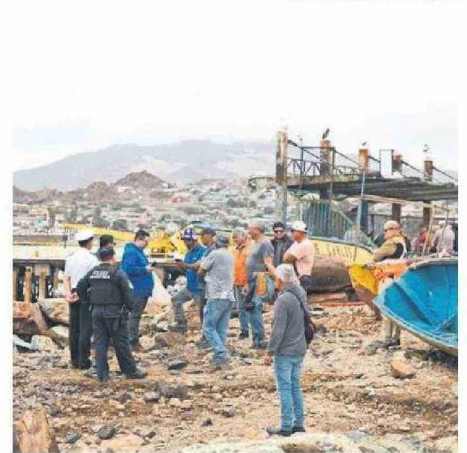
A SIMPLE VISTA PODÍA APRECIARSE LOS DAÑOS PRODUCTO DE LAS MAREJADAS.