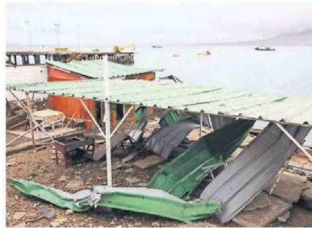
LA COMUNA DE HUASCO FUE UNA DE LAS MÁS SUFRIÓ CON EL FENÓMENO.