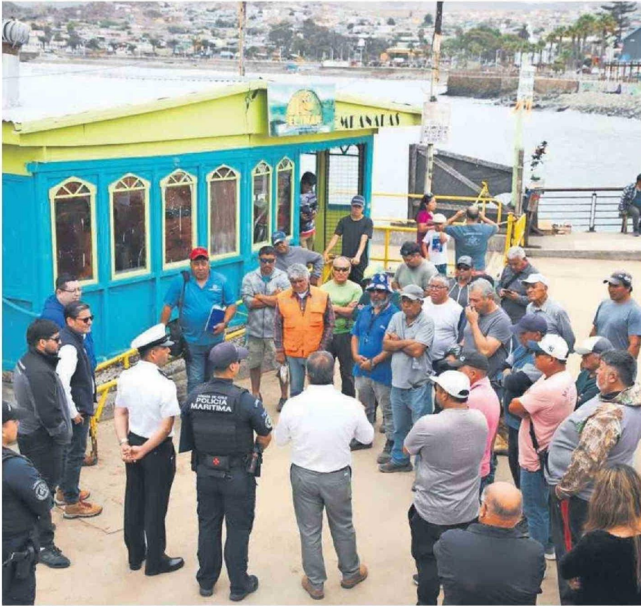
DIRIGENTES SINDICALES, FUNCIONARIOS MUNICIPALES, TRABAJADORES PESQUEROS Y MIEMBROS DE LA ARMADA SE DIERON CITA EN EL BORDE COSTERO.