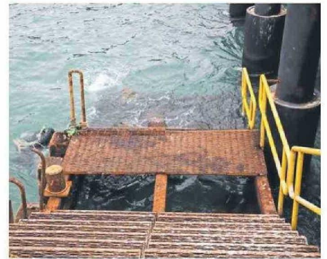
SERÁ NECESARIO GESTIONAR LA ADQUISICIÓN DE RECURSOS PARA REPAROS.