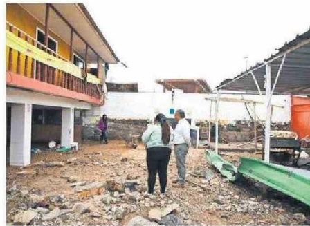
UN RESTAURANTE LOCAL NECESITARÁ AYUDA PARA PODER LEVANTARSE.