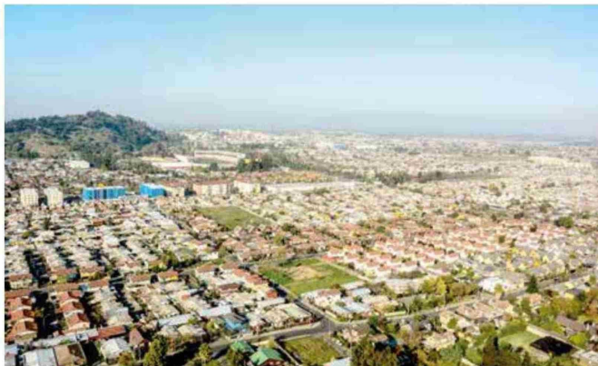
Curicó ha crecido principalmente hacia el sector norte y al oriente de la comuna.

La expansión de la ciudad ha ido de la mano del aumento de organizaciones vecinales, así como nuevos barrios y poblaciones.