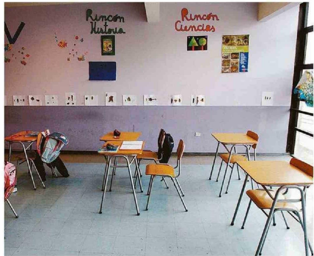
LAS CIFRAS DE ASISTENCIA NO HAN LOGRADO RECUPERARSE AL NIVEL QUE HABÍA ANTES DE LA PANDEMIA.

Frente a ese panorama, el investigador indicó que "hemos visto que la respuesta del Mineduc a este problema ha sido bastante acotada. Existe el Sistema de Alerta Temprana desde el 2019, el cual identifica a los alumnos que presentan más inasistencia, que están en esta situación riesgosa, y los colegios pueden acceder a esta base de datos, ver con nombre y con Rut cuáles son los niños que están en esta situación. Ahora el Mineduc habla de un proyecto que están haciendo junto con el Banco Interamericano del Desarrollo, el BID, en el cual expanden este sistema y lo refinan, pero el problema es que ellos hablan de este proyecto como si fuera algo que estuviera materializándose, pero recién a fines de este año va-