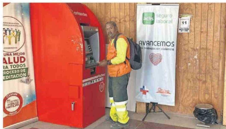
LOS VECINOS DE PAIPOTE CUENTAN CON UN CAJERO EN EL INTERIOR DEL CESFAM.

En Paipote, había un sólo cajero automático en el Cesfam que funciona desde las 8 hasta