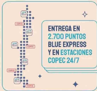
Blue Express ganó el primer lugar en el Ecommerce Day 2024 en la categoría de Logística y Fulfillment.

a domicilio y retiro en más de 2.700 Puntos Blue Express, incluidas 680 estaciones Copec abiertas 24/7.