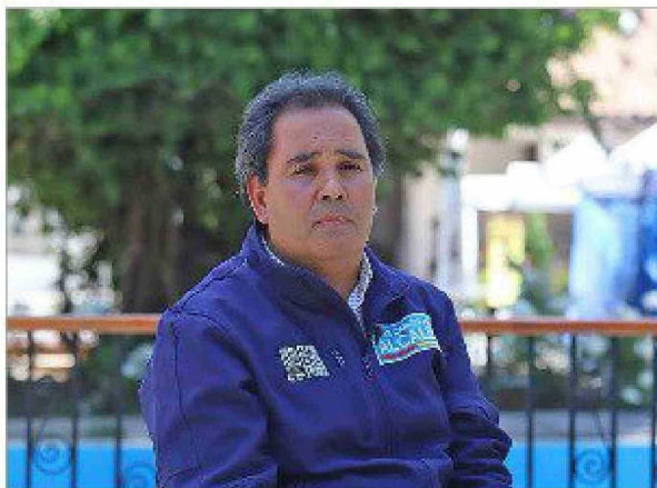
"Nosotros estamos haciendo un trabajo equitativo y transversal, con todas las juntas de vecinos y organizaciones sociales".

del Complejo Guillermo Chacón y convertirlo en el gran Centro Deportivo de la región y buscando los recursos para el Cerro San Juan, reforzar la Farmacia Municipal y crear la Óptica Municipal. "Le decimos a nuestros vecinos y vecinas que sigan confiando en nuestro trabajo y buscando los recursos para que cada presupuesto esté reflejado en la calle", cerró sus declaraciones el alcalde reelecto de Machalí al equipo del diario El Rancagüino. 📰