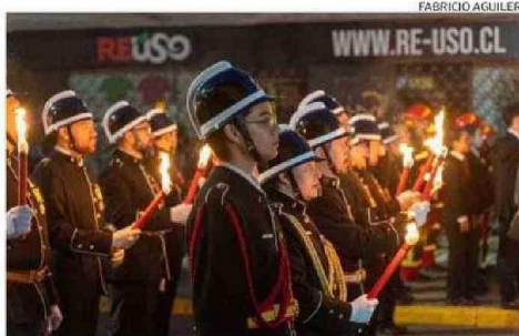
EN LA OCASIÓN PARTICIPARON VOLUNTARIOS DEL CUERPO DE BOMBEROS.