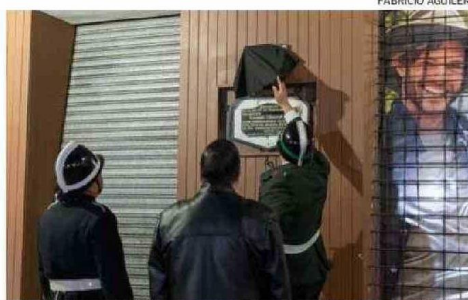
EN EL LUGAR DESCUBRIERON UNA PLACA POR EL ANIVERSARIO N°100.