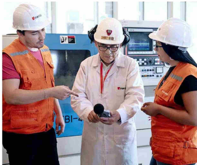
Tras un año de estudios en una carrera del CFT Inacap, la empleabilidad de sus alumnos promedia el 68% y su ingreso los $532 mil.

La ESTP es eficiente en tiempo y costos para quien desee formarse e insertarse prontamente al mercado laboral, destaca Lucas Palacios, rector de Inacap, quien añade que “ofrece a las per-