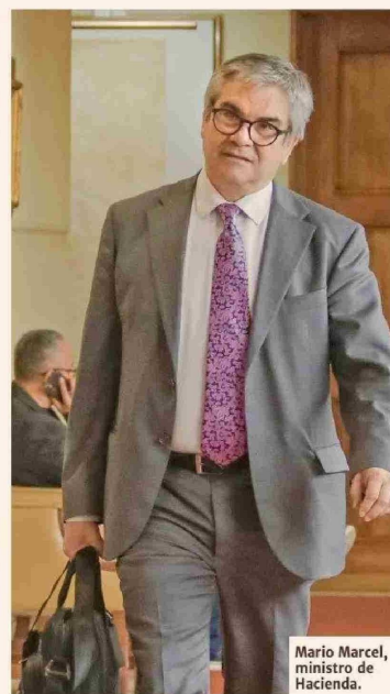
Mario Marcel, ministro de Hacienda.

vo y la oposición? La situación se enredó luego de que este lunes el Presidente Gabriel Boric subiera duramente el tono en contra de la derecha, acusándolos de no ceder y que hay quienes insisten en que una parte mayoritaria de la cotización adicional de 6% debiera ir a cuentas individuales.