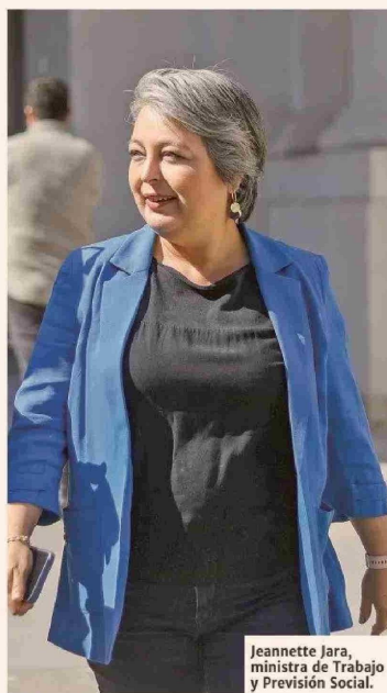
Jeannette Jara, ministra de Trabajo y Previsión Social.