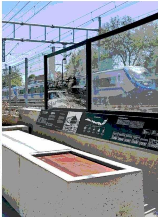
Más que una banca, este volumen permite que los niños se apoyen para trabajar con sus profesores.

precio del terreno, considerando que se trataba de 120 hectáreas. Hoy en ese terreno hay distintas tipologías inmobiliarias; y el paso de los años no solo va dañando los pocos remanentes que quedan de la mastranza, sino también contribuye a olvidar el polo de desarrollo que significó esta industria para la ciudad. Solo hay que considerar que la población sanbernardina aumentó en un 54% durante la década de 1920. También hay datos de las locomotoras que se fabricaron, como la Juan Antonio Ríos, hecha íntegramente in situ en 1942.