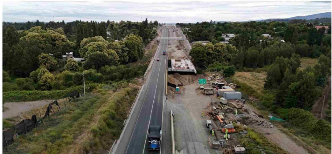
LA CONSTRUCCIÓN DE LA RUTA NAHUEL BUTA representa una inversión de 250 millones de dólares.

El mejoramiento de la Ruta Nahuelbuta no es una idea reciente. La necesidad de fortalecer la conectividad entre Biobío y Malleco se planteó hace más de 20 años y, de hecho, el proyecto tiene antecedentes aún más antiguos. Ya en la década de