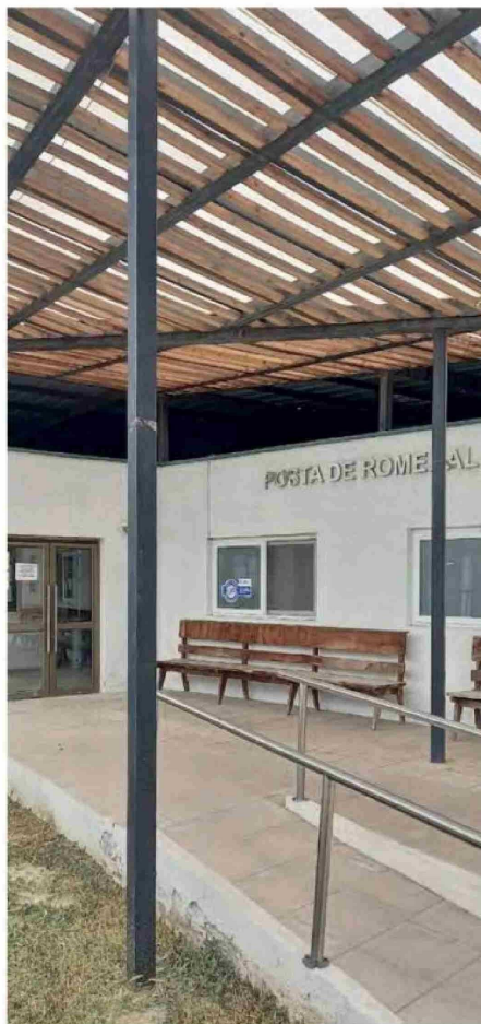
La actual y moderna Posta de Salud Rural de Romeral, donde ahora trabaja un completo equipo de salud primaria.