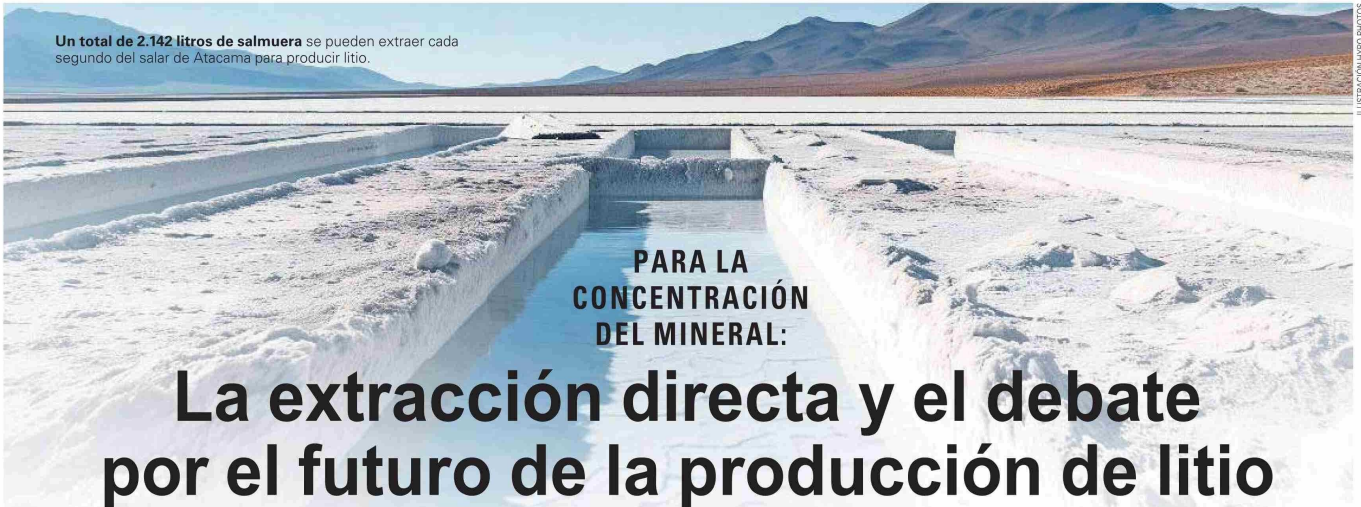
Un total de 2.142 litros de salmuera se pueden extraer cada segundo del salar de Atacama para producir litio.