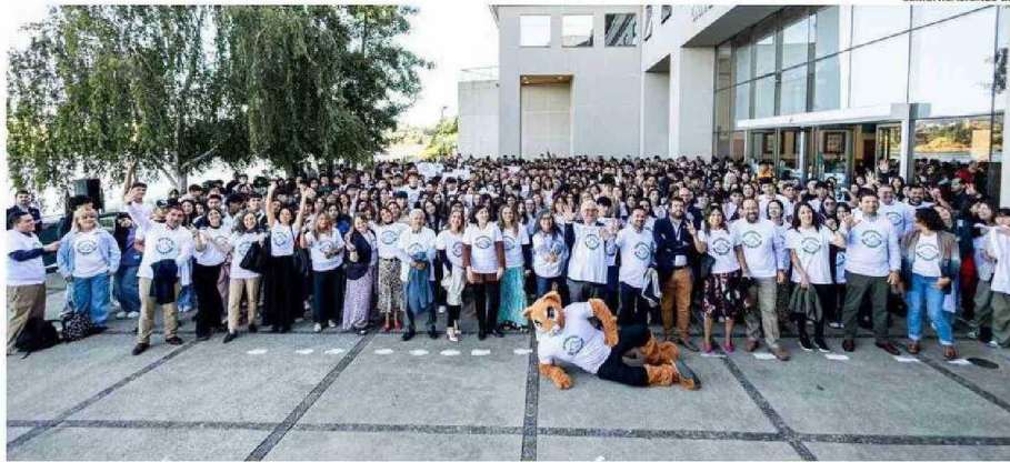
EN LA SEDE VALDIVIA DE LA UNIVERSIDAD SAN SEBASTIÁN, EL MARTES 25 COMENZARON LAS ACTIVIDADES DE RECEPCIÓN PARA LOS NUEVOS ESTUDIANTES.

De esta manera, se realizó la Feria MiUSS, un espacio interactivo donde para conocer los servicios y beneficios institucionales, explorar la oferta de talleres extracurriculares y disfrutar de actividades recreativas y música en vivo. El miércoles fue el turno de la ceremonia de bienvenida para padres, quienes co-