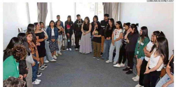
LOS ESTUDIANTES DE PRIMER AÑO DE LA U. SANTO TOMÁS TUVIERON UNA SERIE DE ACTIVIDADES DE INTEGRACIÓN.