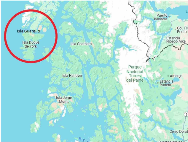
A 248 kilómetros de distancia de Puerto Natales se emplaza la mina de caliza Isla Guarello, una de las últimas aún operativas en Magallanes.

● En la isla opera una mina de caliza perteneciente al holding CAP. Ante la crisis de Huachipato, hay voces que advierten un posible cierre y otras que lo descartan. En caso de cerrar, ya hay quien propone ubicar allí una cárcel de alta seguridad.