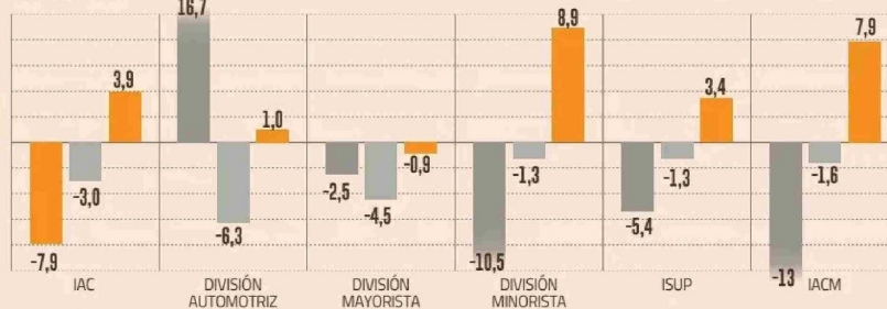
EL COMERCIO SE RECUPERA EN 2024 VAR. % 12 MESES

Con estimaciones levemente por encima de lo ocurrido en mayo (1,1%), se ubicaron se Gemines e Inversiones Security, que apuestan por un 1,2% anual. Más optimistas, el Observatorio del Contexto Económico de la Universidad Diego Portales (OCEC-UDP) y BICE Inversiones se anotaron con pronósticos para el Imacec de 1,6% y 1,7% anual, respectivamente. Itaú, estima un 1,8% en 12 meses para el indicador que elabora el ente autónomo. En algunos casos, como el de BCI, los cálculos incluso llegaron a 2,1%.