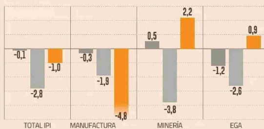
EL COMPORTAMIENTO DE LA ACTIVIDAD FABRIL VAR. % 12 MESES