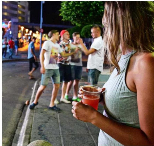
La igualdad de oportunidades que han ido adquiriendo las mujeres también se traspasa al acceso y uso de drogas como el alcohol, lamenta Álvaro Castillo, director del Núcleo Milenio para la Evaluación y Análisis de Políticas de Drogas.

añade, algunas adolescentes y jóvenes, “en quienes culturalmente hay una mayor conciencia de la imagen”, lo usan para quitar el apetito y luchar contra el aumento de peso.