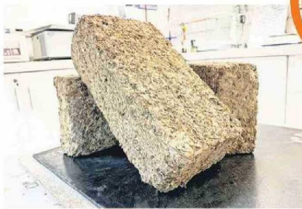
LOS BLOQUES ESTÁN HECHOS DE RAMAS Y HOJAS DE LOS BOSQUES.

Bloques, hechos a partir de los restos que ayudan a expandir los incendios forestales, son usados con seguridad en estufas a combustión lenta.