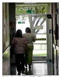
Actualmente, hay 2,5 millones de prestaciones atrasadas.

Otra propuesta, indica Sánchez, es "flexibilizar en forma inteligente la gestión médica para incentivar el trabajo fuera de horarios normales, sujeto a normas e incentivos claros y bien gestionados y supervisados para evitar el abuso", y "resgatar más recursos a establecimientos que claramente lo requieren, pero amarrados a cumplimiento de indicadores y metas, sancionando el incumplimiento".