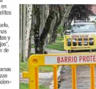
Las medidas de seguridad deben involucrar un esfuerzo mancomunado entre diversas instituciones, plantean especialistas.

Añade que "luego la estrategia debe considerar incentivos económicos para las familias y municipios para la reinserción escolar de jóvenes desahucados, instalación de 'oficinas de oportunidades laborales' de cooperación público-privada para dar trabajos lícitos a jóvenes y adultos".