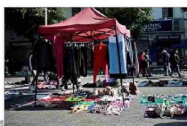
DERRUIDOS.— Sectores de la capital como Meiggs o la Vega Central se han deteriorado de la mano de la actividad informal.

Con distintos tipos de medidas, que van desde equipos de fiscalización hasta el aumento de permisos municipales, algunas autoridades han buscado enfrentar el fenómeno del comercio ambulante, que prolifera en barrios comerciales de las distintas ciudades.