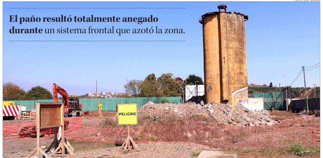
El paño resultó totalmente anegado durante un sistema frontal que azotó la zona.

Twitter @DiarioConcepcion contacto@diarioconcepcion.cl