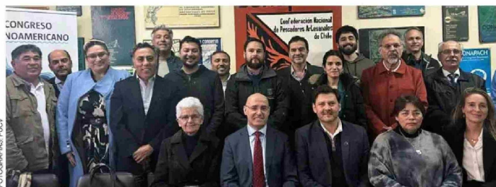
Miembros del Comité Consultivo para la sede de la Secretaría BBNJ en Valparaíso.