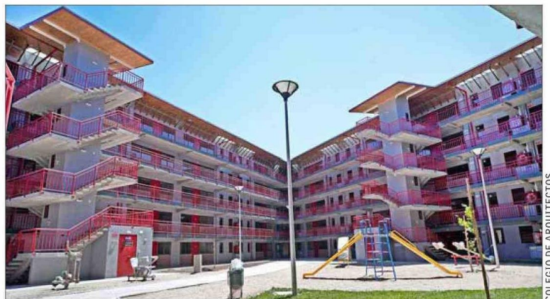
COLEGIO DE ARQUITECTOS

El barrio Maestranza Ukamau , en Estación Central, es una de las obras más importantes de este profesional formado en la Universidad Católica.