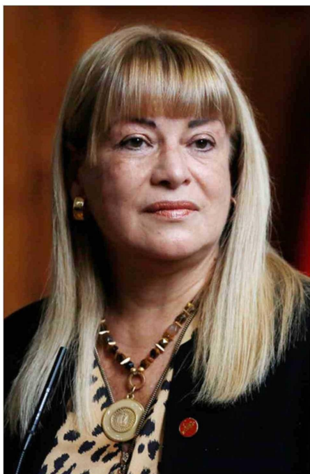
ÁNGELA VIVANCO, ministra de la Corte Suprema.