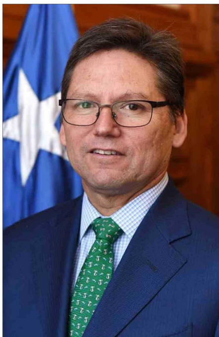
JEAN PIERRE MATUS, ministro de la Corte Suprema.