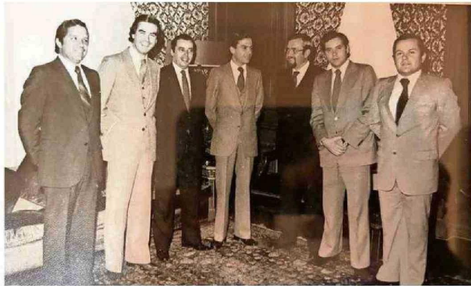
UN RECUERDO JUNTO A ALCALDES DE TALCAHUANO, VIÑA DEL MAR, CONCEPCIÓN, SANTIAGO, VALPARAÍSO Y CHILLAN

un nuevo cónsul que le representara en Valdivia y que había pensado en mí, y me consultó si estaba interesado.