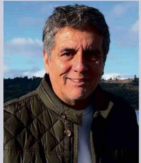
EL EXDIPUTADO CHILOTE ALEJANDRO SANTANA VUELVE A UNA ELECCIÓN POPULAR.

-El desarrollo económico y social, la seguridad, la sustentabilidad y