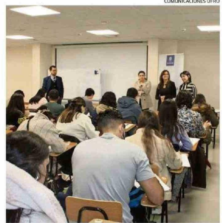
LOS ESTUDIANTES QUE RINDIERON EL EXAMEN RECIBIRÁN UN CERTIFICADO QUE ACREDITA SU PARTICIPACIÓN EN EL SEGUNDO PILOTO ENO.