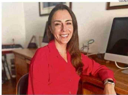
Churruca es una de las autoras y magíster en neurociencias.

En esa línea, la especialista plantea que "a diferencia de otros métodos como la saliva, la orina o la sangre, el análisis de uñas permite evaluar el estrés acumulado durante un período prolongado. Esto lo convierte en una herramienta más fiable para en-