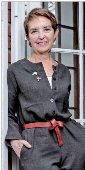
Presidenta de Evópoli, Gloria Hutt