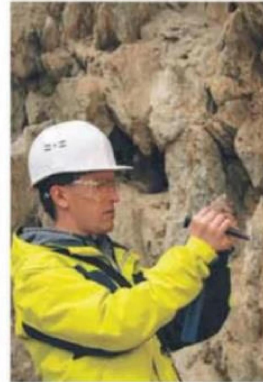
Las tres nuevas carreras que la Universidad San Sebastián estrena en 2025: Ingeniería en Recursos Naturales y Sostenibilidad, Geología y Licenciatura en Ciencias de la Actividad Física.