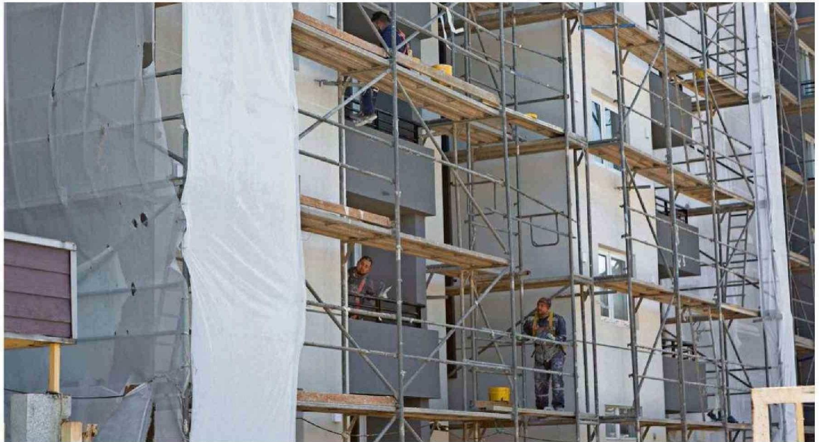
EN LA CONSTRUCCIÓN APUNTAN A LA CAPACITACIÓN UNA VEZ TITULADOS LOS ESTUDIANTES DE LOS ESTABLECIMIENTOS TÉCNICO PROFESIONALES.

Y uno de ellos, según dice, es la disminución de la brecha de ingreso de mujeres a carreras que antes eran considera-