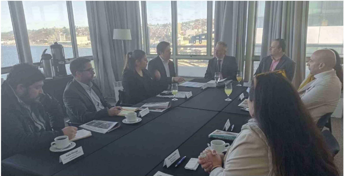
DIVERSOS ACTORES DEL ÁREA EDUCACIONAL Y PRODUCTIVA ANALIZARON LAS TAREAS QUE TIENE LA EDUCACIÓN TÉCNICO PROFESIONAL EN LA REGIÓN Y EL PAÍS.