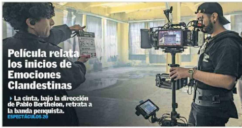
Película relata los inicios de Emociones Clandestinas La cinta, bajo la dirección de Pablo Berlín, retrata a la banda penquista. ESPECTÁCULOS 28