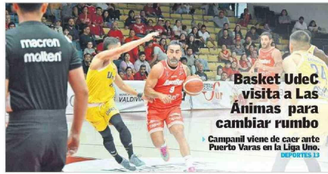
Basket UdeC visita a Las Ánimas para cambiar rumbo Campanil viene de caer ante Puerto Varas en la Liga Uno. DEPORTES 13