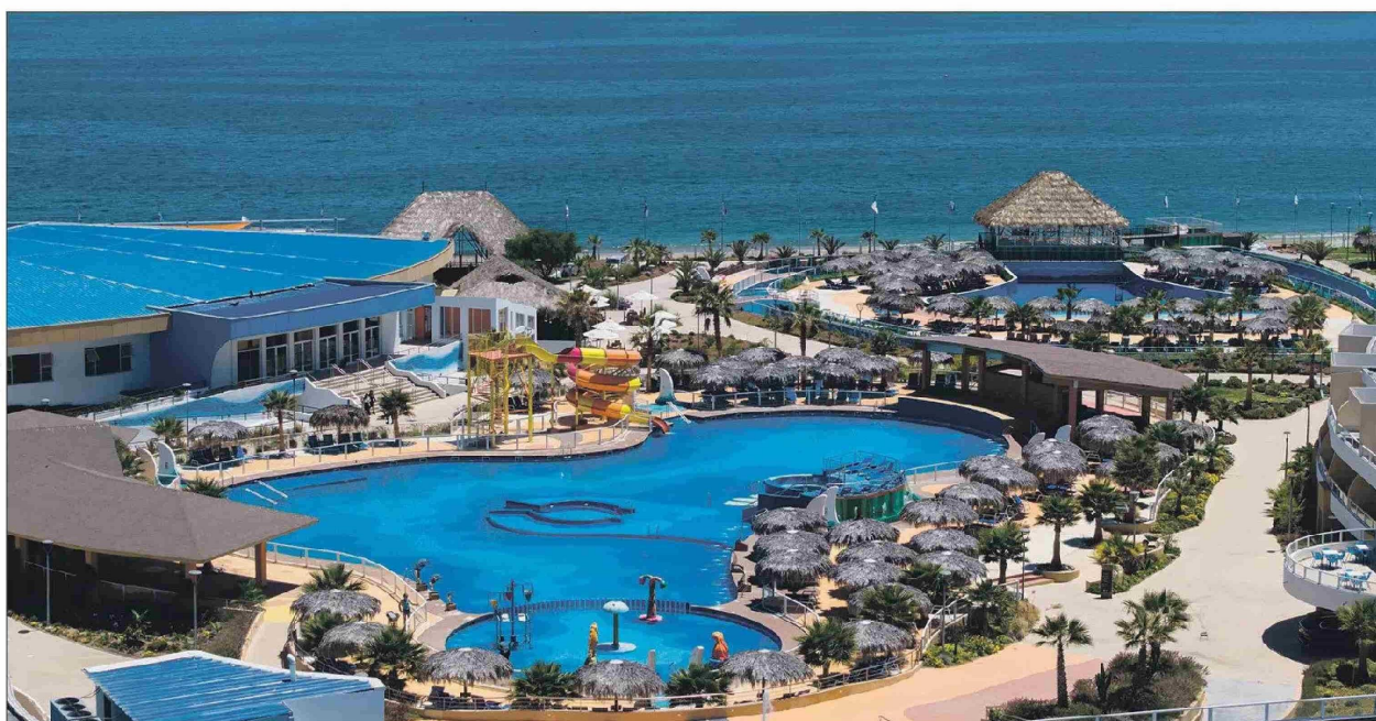
Además de las piscinas, el recinto tiene salida directa a la playa.