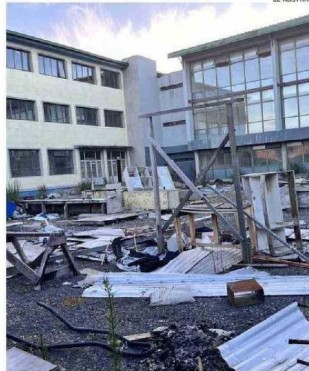
EL LICEO CARMELA CARVAJAL ESTÁ PARADO DESDE MAYO DEL 2022.