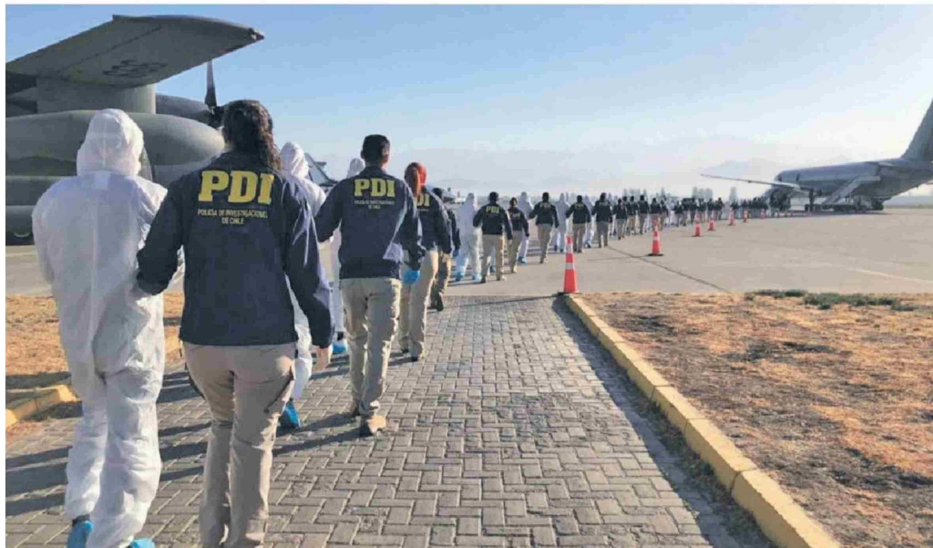
► Las expulsiones colectivas realizadas en el gobierno de Sebastián Piñera fueron criticadas por la oposición debido al trato y las condiciones en que eran sacados los migrantes.

A ello Thayer suma que “hemos realizado 16 vuelos chárter con la Fach, que nos permite reducir los costos”. Pero lejos de ser un servicio “gratuito”, la Fuerza Aérea cobra a Migraciones por cada uno de los vuelos de expulsión. Por los ocho que habían