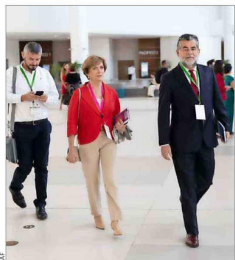
Llegada de Evelyn Matthei al encuentro junto a su asesor político Rodrigo Ubilla, exsubsecretario del Interior, y asesor político de su campaña presidencial.

Evelyn Matthei en el panel por el crecimiento, donde destacó el caso argentino como un modelo imitable. “El gasto fiscal hay que reducirlo, como lo está haciendo en este momento Argentina, que por primera vez ha tenido un superávit fiscal”.