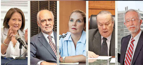
Soledad Alvear , asesora y ministra de Justicia.