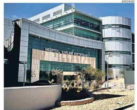
HOSPITAL DE CALAMA INVESTIGA FALLECIMIENTO DE MUJER DE 41 AÑOS.