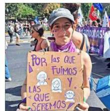
KARINA JOVEN MADRE

Asimismo, González plantea que “entre otras muchas acciones, las políticas públicas deberían incorporar las necesidades, propuestas y saberes de las per-