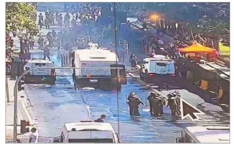
DESMANES.— Alrededor de 200 manifestantes cortaron el tránsito frente a la Biblioteca Nacional.

sonas mayores. Además, estas políticas deben asumir enfoques que aporten de forma ineludible a la equidad en la distribución de los cuidados en la vejez, y que contribuyan a eliminar la discriminación por edad en los diferentes ámbitos de la vida”.