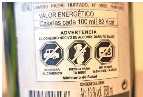
Botellas y cajas de bebidas alcohólicas ya incorporan el etiquetado.

Consumo de Sustancias y el Tratamiento de las Adicciones (Cesa), de la U. de Chile. Al día, 36 chilenos mueren por esta causa: "Hablamos desde homicidios, accidentes de tránsito, suicidios hasta enfermedades en que el alcohol es un importante factor de riesgo como la cirrosis y algunos cánceres".