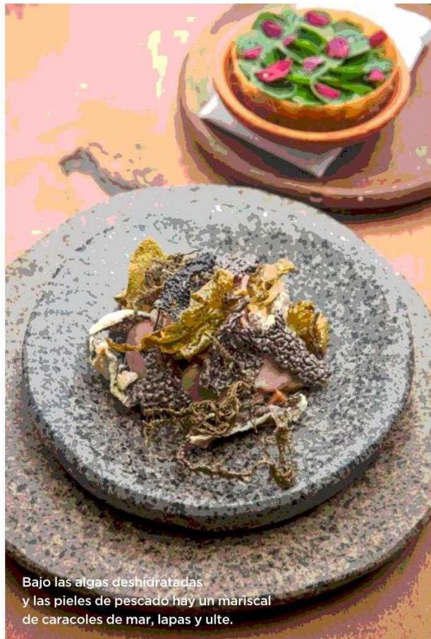
Bajo las algas deshidratadas y las pieles de pescado hay un mariscal de caracoles de mar, lapas y ulte.