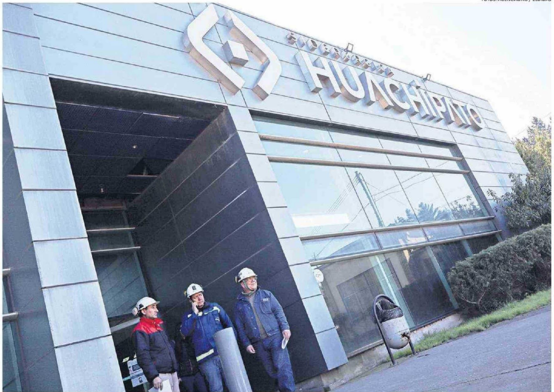
EL CIERRE DE LA COMPAÑÍA SIDERÚRGICA HUACHIPATO Y OTRAS EMPRESAS EMBLEMÁTICAS DEL GRAN CONCEPCIÓN, COMO FANALOZA, GENERAN ENORME INQUIETUD.

"Estamos mandatados por el Presidente Gabriel Boric, a trabajar arduamente en un programa que se comenzó a abordar desde la Mesa de Defensa del Empleo y la Industria Regional; es decir, nace a partir de un diálogo tripartito", expresó la secretaria regional ministerial del Trabajo y Previsión Social del Bio-