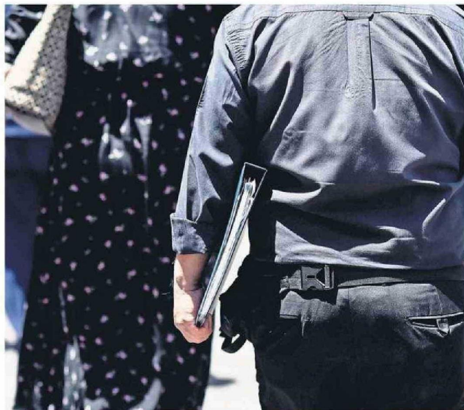
EN UN 8,5 POR CIENTO SE SITUÓ LA TASA DE CESANTÍA REGIONAL EN EL ÚLTIMO TRIMESTRE MÓVIL.

las recesiones que nosotros hemos visto en la historia, la inversión retrocede fuertemente debido a que el inversionista está para ganar rentabilidades. Cuando tenemos bajos crecimientos económicos, el Estado es quien puede estimular la economía, a través del aumento del gasto público para generar puestos de trabajo y oportunidades de inversión. Es el ente que debe apoyar a las grandes, medianas y sobre todo a las pequeñas empresas, que tienen menor espalda financiera. Podría, también, conversar con la banca de manera que ésta pueda dar