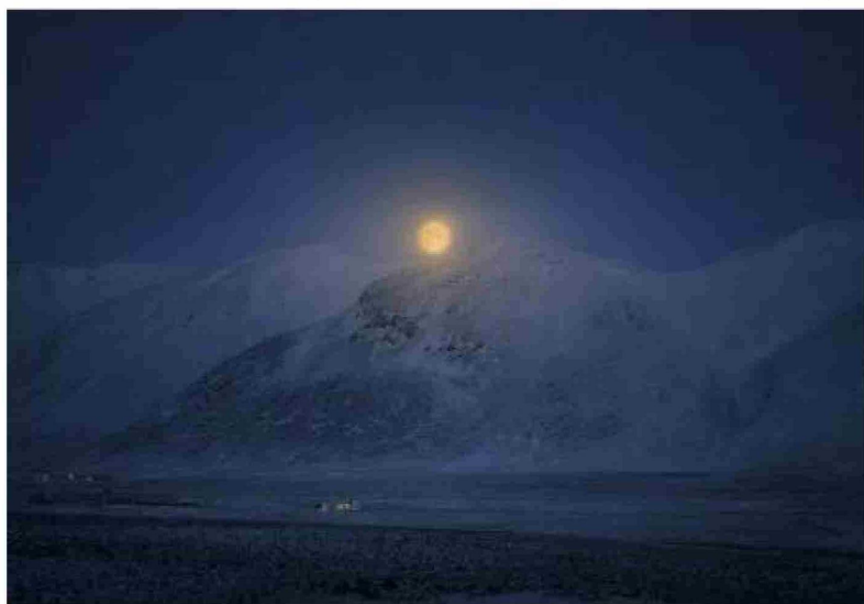
La luna llena se eleva sobre las montañas invernales de Breiðabólstaðir (Islandia), iluminando la belleza del paisaje nevado.

Sentí una oleada de sentimientos positivos mientras miraba las estrellas en aquella