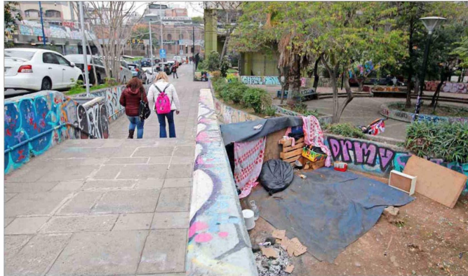
DETERIORO URBANO. — La presencia de carpas ha sido un foco de inseguridad y de acuerdo con los residentes, quienes viven en ellos cometen delitos en el sector. La fotografía fue tomada ayer, a las 17:35 horas.

Advierte que ingresaron un oficio a la Contraloría para que resuelva sobre la falta de acciones que ellos observan y, además, volverán a recurrir a la Cor-