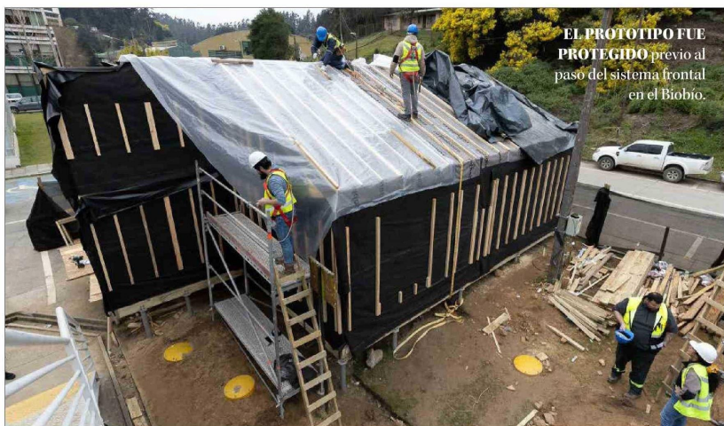
EL PROTOTIPO FUE PROTEGIDO previo al paso del sistema frontal en el Biobío.

mejorando así el confort térmico interior, en línea con las nuevas actualizaciones de normativas.