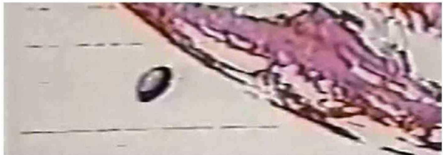
NUEVO INFORME DEL PENTÁGONO REVELA INCIDENTES CON OVNIS QUE NO TIENEN EXPLICACIÓN.

¿Se ha encontrado evidencia de vida extraterrestre? No. Pero, ya desde el