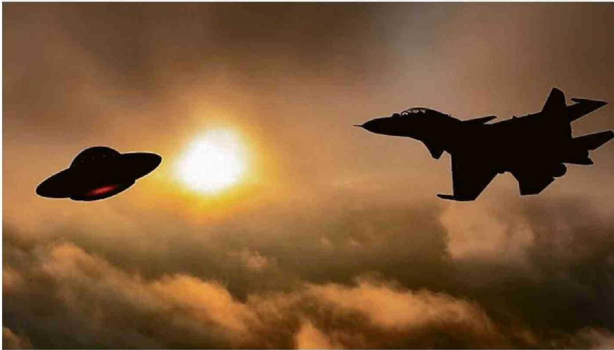
NUEVO INFORME DEL PENTÁGONO REVELA INCIDENTES CON OVNIS QUE NO TIENEN EXPLICACIÓN.