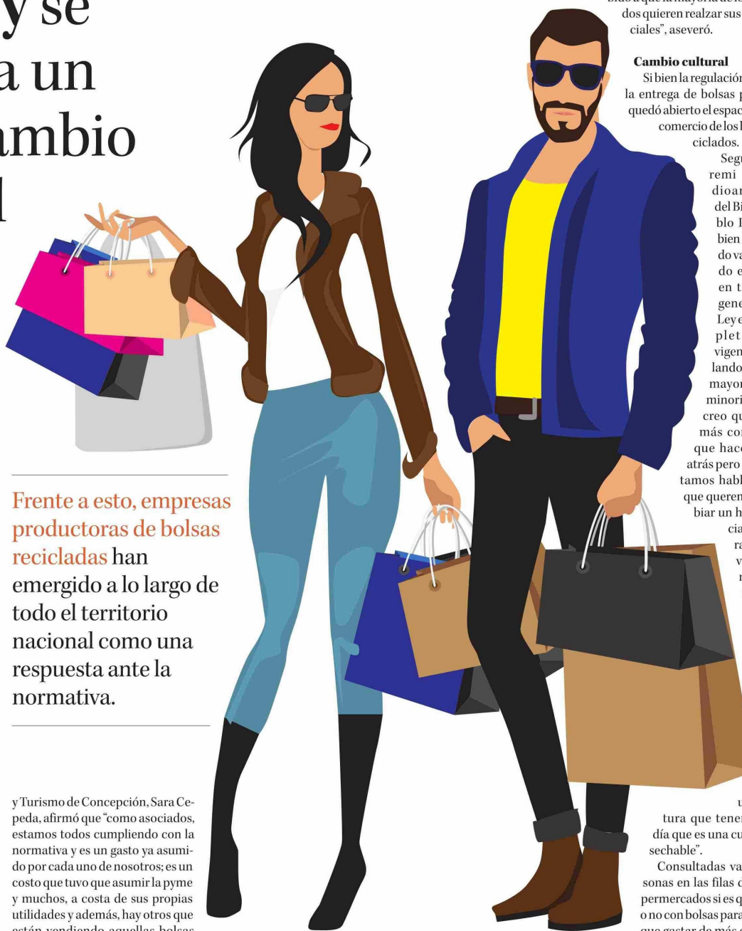
ILUSTRACIÓN: ANDRÉS OREÑA P.

Consultadas varias personas en las filas de los supermercados si es que llegan o no con bolsas para no tener que gastar de más en bolsas