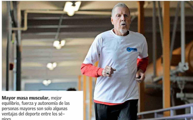
Mayor masa muscular, mejor equilibrio, fuerza y autonomía de las personas mayores son solo algunas ventajas del deporte entre los seniors.

Sobre los beneficios que el dedicarse al arte le ha aportado, la pintora destacó el sentirse acompañada y que la "obliga a mirar y pensar diferente. Hace que la mente esté alerta".